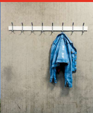
Rose Eken - Denim Jakke Frederiksbjerg Skole Aarhus Kommune, 2016