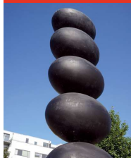
Foto: Niki Bok Rosmusen Sophia Kalkou - Sort Seje Søndergård Ballerup Kommune, 2012