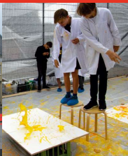
Foto: Rune Fjord Rune Fjord Studio Mere lys - Laboratorie Lærings- og kunstprojekt Gentofte Kommune, 2018