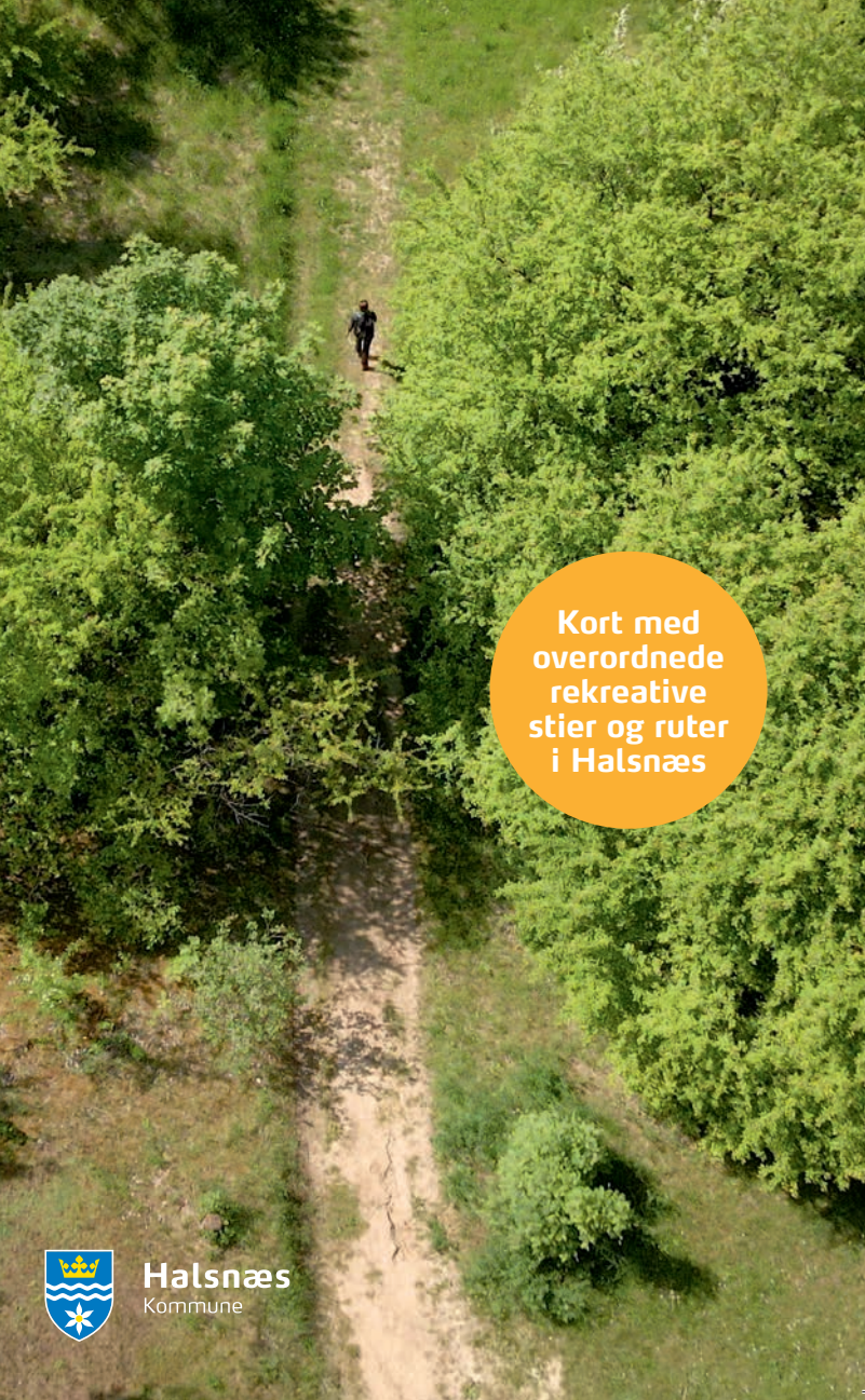
Kort med overordnede rekreative stier og ruter i Halsnæs