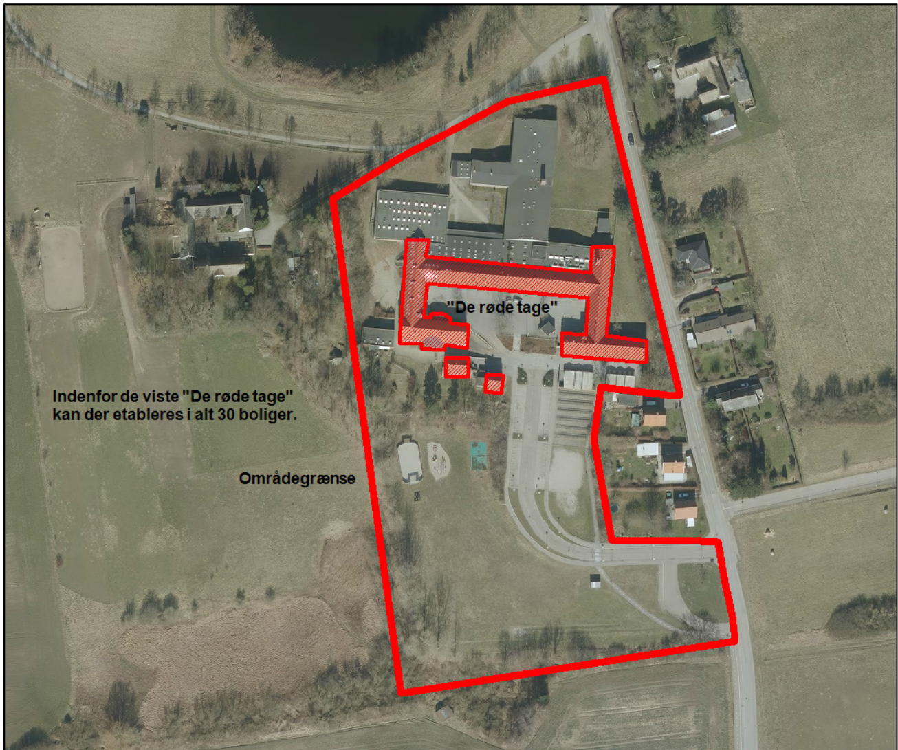
Kort 1 – Bygninger der kan indrettes til boliger er vist med rød skravering.

Boliger er omfattet af liste 1 i tilladelseslisten (bilag 1 til Vandplanerne), hvor risikoen for forurening af grundvandet er mindst. Grundvandet sikres ved indførelse af en retningslinje om, at parkerings- og kørselsarealer skal være befæstede. Grundvandsdannelsen vil ikke blive mindsket ved ændringsanvendelsen, da en større del af den eksisterende bebyggelse vil blive nedrevet – og de samlede befæstede arealer vil blive mindre – i begge tilfælde erstattet af grønne arealer.