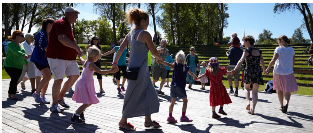
Afslappet og rart samvær på friluftsscenen i Halsnæs

Både vores egne hverdagsoplevelser og de indtryk, gæster får hos os, er båret af aktiviteter i naturen og på vandet, af de lokale fællesskaber, som allerede er og spirer i Halsnæs, men som kan blive stærkere, mere udtalt og lettere tilgængelig. Der er masser af potentiale.