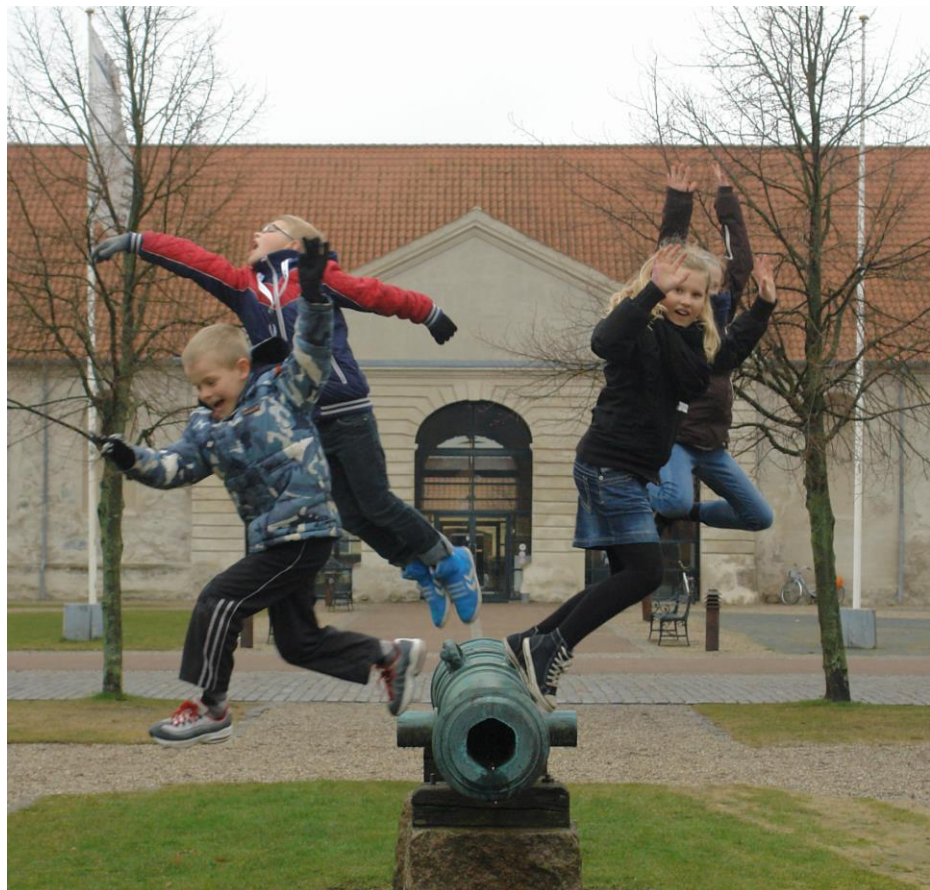
Gjethuset – rammen om flere kulturoplevelser og her med god energi på en efterårsdag

Der er mange andre ideer og forslag. Det er op til os alle – sammen og hver for sig – at leve, byde ind og udfolde visionen kreativt i den fælles retning.