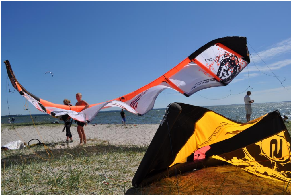
Strand- og surfingoplevelser en sommerdag i Halsnæs

Vi oplever et Halsnæs, hvor de lokale virksomheder får nye kunder og udvikler nye aktiviteter med udgangspunkt i visionens potentialer. Vi skaber sammen en synergi mellem virksomhedernes forretning og de rå og autentiske oplevelser, så nye kunder tiltrækkes af vores håndværk, vores industri og vores tilbud til turister.