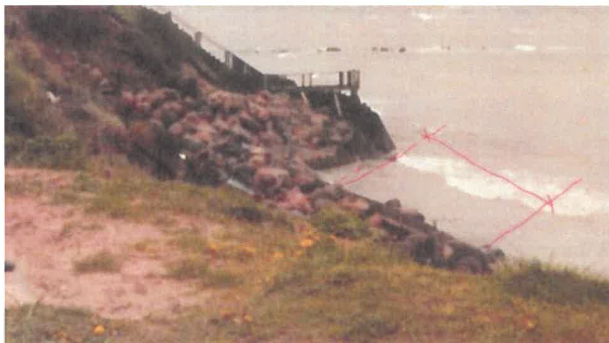
Fig. 2 Spunsvæg og stensætning set ovenfra fra matr.nr. 21bo (nabogrunden) – billedet er fra 1983