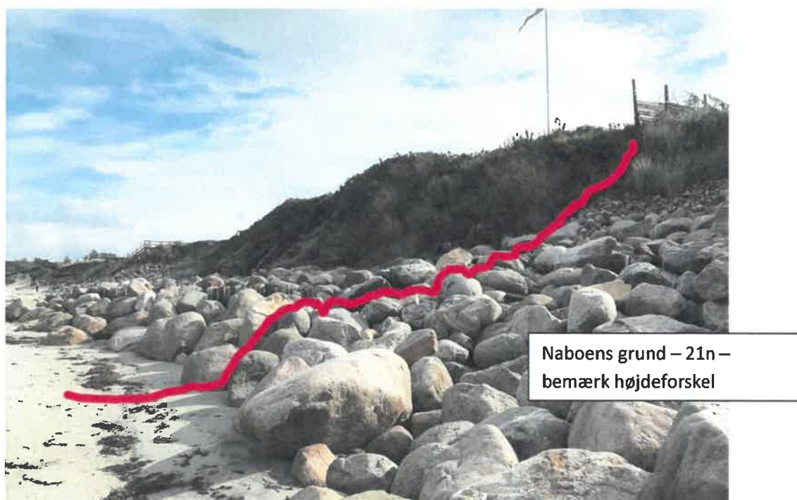
Fig. 2 Nabo mod vest. Matr.nr. 21n til højre, min grund matr.nr. 21bu til venstre