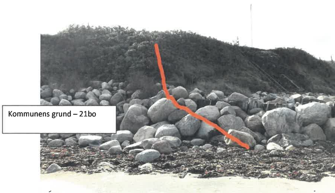
Fig. 1 Nabo mod øst. Matr. nr. 21bo til venstre, (min grund) 21bu til højre for den røde streg.

Foto af stenlægning hos naboerne: Billederne er taget den 28.sep. 2019