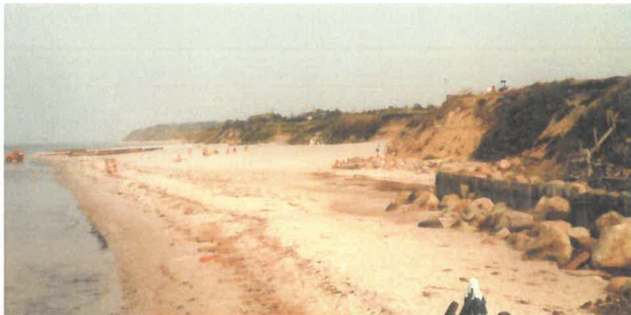
Fig. 1 Stranden foran matr. nr. 21bu med spunsvæggen set fra vest mod øst – september 1984

Bilag 6. Foto dateret til ca. 1985. Billederne er taget lige før man skulle lave forsøg med sandfodring ud for matrikel 21bo – den offentlige strand, i perioden 1984 til 1987.