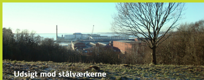
Udsigt mod stålværkerne

På bakkekammen lå der tidligere en række krudttårne. Bygningerne fungerede som depoter for det færdige krudt, der blev produceret på Krudtværket i Frederiksværk. I dag kan du se små plateauer i terrænet på de steder, hvor krudttårnene har stået.