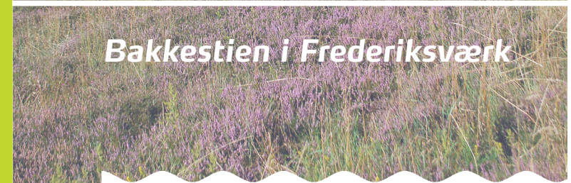
Bakkestien i Frederiksværk