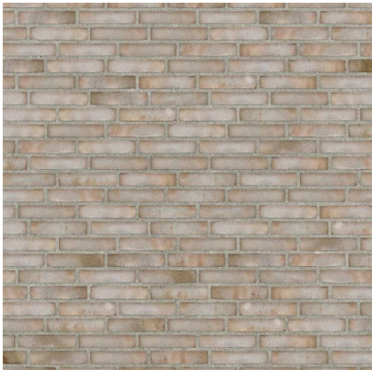
Den ønskede mursten til boliger og fælleshus B542 Laika

På nedestående billeder ses det facade- og tagmateriale som der ønskes dispensation til.