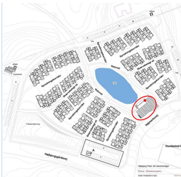
Lokalplan 09.7 kortbilag 2. Den røde ring viser placeringen af fælleshuset.

Nedenfor ses fælleshuset placering på kortbilaget i lokalplan, samt den placering som ejerne af området ønsker.